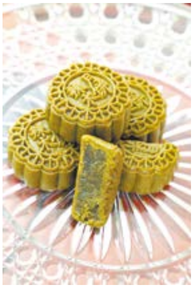
辣木月饼。