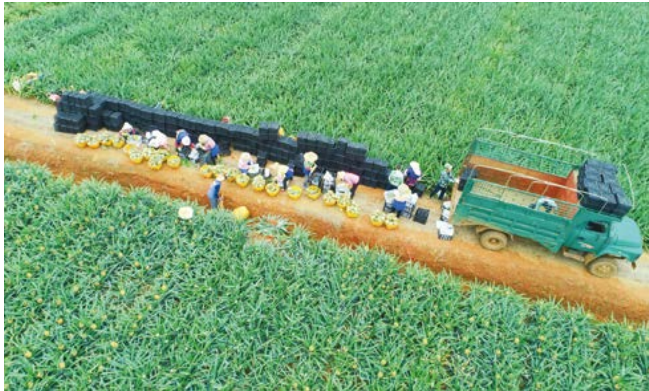
农户把菠萝装车。

网红带一千位农民到“菠萝的海”搞直播进行带货，百名网红中最远的一位来自新疆，还有来自上海等全国各地的网红，他们到徐闻来，教徐闻农民如何通过短视频平台直播卖菠萝。徐闻的七个菠萝主产镇，每个镇有一百多位农民来参与直播卖菠萝，这场直播也被誉为一大培训、大卖场、大擂台，开辟了广东农业直播的一个新天地。百名网红和千名农民主播同时现身世界最大的菠萝天然博物馆“菠萝的海”直播带货，使徐闻实现了从中国菠萝种植第一县到中国直播第一县的华丽转身。千名果农同时在红土芬芳的“菠萝的海”接受数字营销大培训，开辟了全新的培训模式，将课堂设在没有围墙的大地上、田野上。让农民会种又会卖，实现了果农