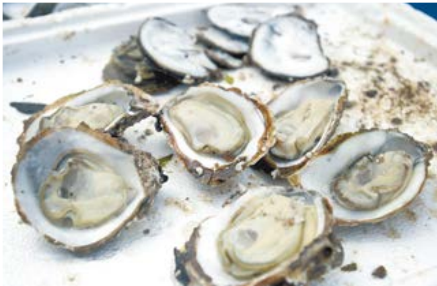
肥美新鲜的生蚝。

年起，湛江先后获得“中国海鲜美食之都”“中国对虾之都”“中国金鲳鱼之乡”等称号。2018年，湛江成功在国家知识产权局商标局申请注册了“湛江鸡”“湛江硇洲龙虾”“湛江硇洲鲍鱼”“湛江蚝”“湛江海水稻”等地理标志证明商标。