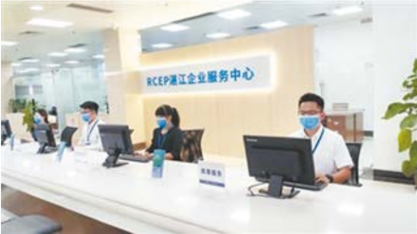
9月29日，RCEP 湛江企业服务中心揭牌试运营。

湛江是广东耕地面积最多、农业总产值最大、现代农业产业园区最多的地级市，湛江对虾、