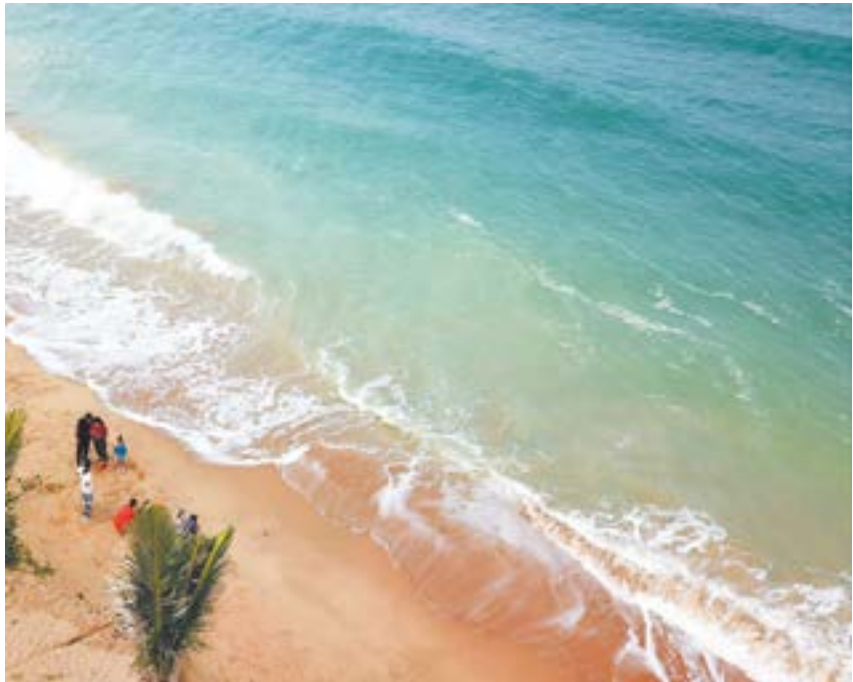
徐闻南极村海滩。

在后疫情时代，自驾游、自由行越来越主流，雷州半岛西海岸各镇也迎来了不少外地游客，大家也纷纷被这些隐藏的美好所折服。从旅游的角度来看，未开发的地方有其不足，但恰因为未开发，也有其小而美和原始美的优势。雷州半岛的西海岸，就是这样一条安静、优美而壮丽的旅游资源带，也许它还需要时间才能完善其文旅产业链，但它的美好值得我们随时去奔赴。