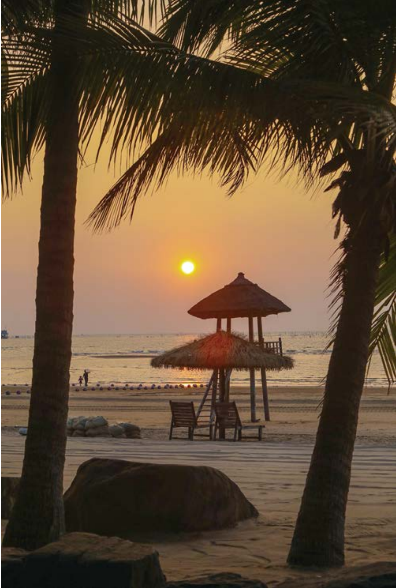
乌石天成台海边布满巨石，乌黑发亮，形状各异。