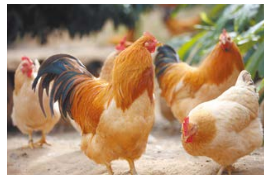
安铺人在林地放养的鸡，外形好看，是地道的安铺鸡。

作为雷州半岛北部的商业重镇和曾经的航运中心，安铺镇是粤琼之间的商业驿站和工业基地，也因此催生了独特的美食文化。安铺最有名的一道菜当属安铺鸡，这是广东白斩鸡中的“明星”。安铺鸡要选用本地肥嫩的“走地三黄鸡”，最好是 4 公斤以下的