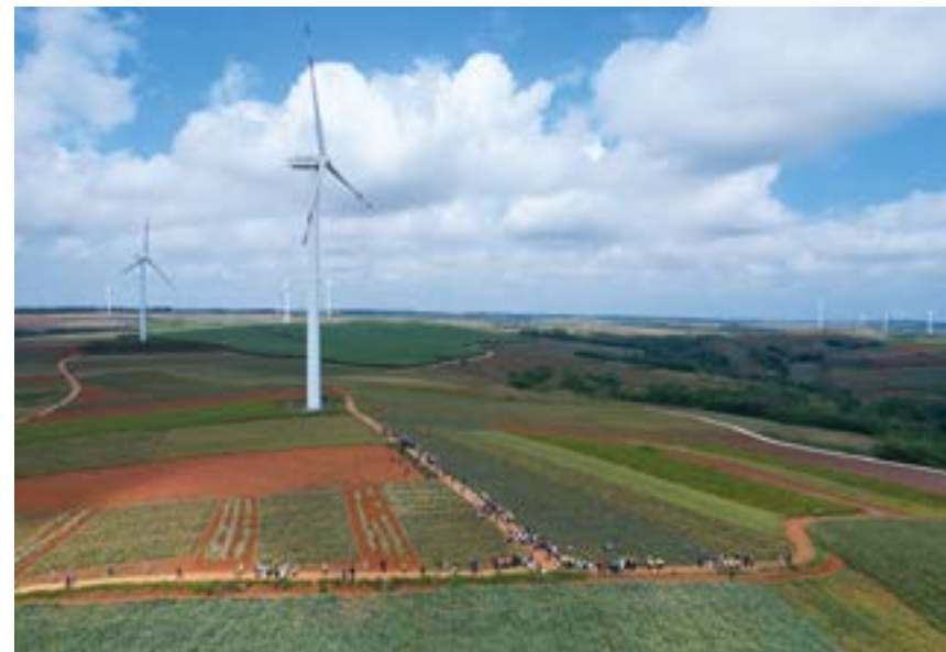
“菠萝的海”风车群。

徐闻海上风电项目是同期项目中一次性开工容量最大、开工时间最晚的项目，并遇到了船机、钢材等涨价潮的高峰，时间紧、体量大。在广东公司的正确领导下，徐闻海上风电建设团队始终坚定信心，坚持目标导向，从加强党的领导、项目管理、关键路径、保障供应、奖励激励、精诚协作等6大方面着手，克服船机资源