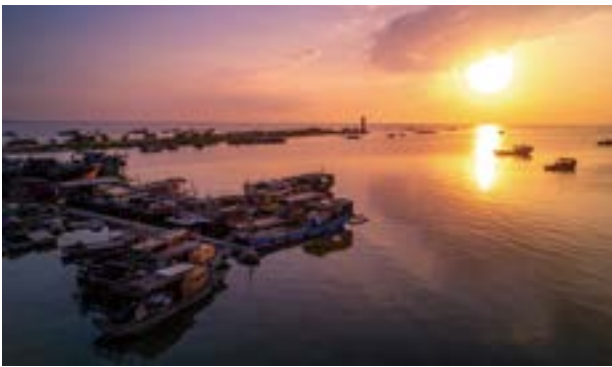
落日余晖下的北潭港，寂静安宁。

十大渔港之一。在合并了下六镇之后，草潭拥有了一个非常令人垂涎的美食阵容：北部湾海鲜、下六沙虫、下六番薯、草潭瑶柱。渔港的夜生活也很繁华，因为渔船往往是凌晨回港，这里的人们早已习惯了昼伏夜出，夜市吃到半夜一两点很寻常。界炮镇因为有著名的北潭蚝场，当地生蚝最为有名，是湛江蚝的核心产区。草潭、界炮一带的渔港游是湛江本地人的心头好，每到开渔季节都有很多市民驾车去尝鲜，不但可以吃到上等海货，还能在当地沙滩赶海、挖沙虫、吃农家菜。 江洪镇也是雷州半岛西海岸最负盛名的渔港之一，这里的“天光鱼市”非常有名，每到开渔季节，人们会争相驾车到江洪去赶鱼市，凌晨四五点就开始抢购北部湾刚打捞上来的生猛海鲜。乌石镇和江洪类似，但更加繁华，这里是国家级中心渔港，整个海岸上遍布酒家食肆，民宿也更多，附近还有湿地公园、海滨度假村，文旅配套最为齐全。 流沙、西连两镇环抱着流沙湾，是南珠的核心产区，但海水养殖业也很发达，石斑鱼、金鲳鱼出产丰富。如果有当地朋友带路，海钓、赶海体验都很不错。