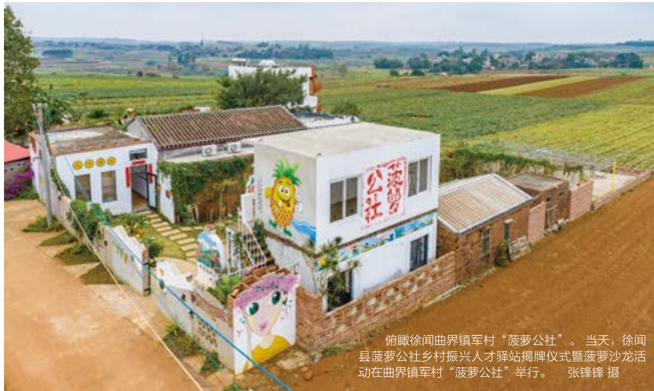
俯瞰徐闻曲界镇军村“菠萝公社”。当天，徐闻县菠萝公社乡村振兴人才驿站揭牌仪式暨菠萝沙龙活动在曲界镇军村“菠萝公社”举行。