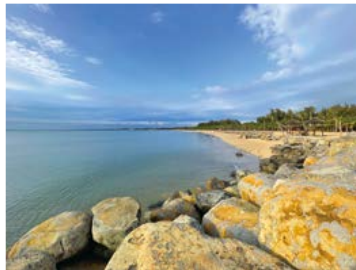
雷州乌石天成台。