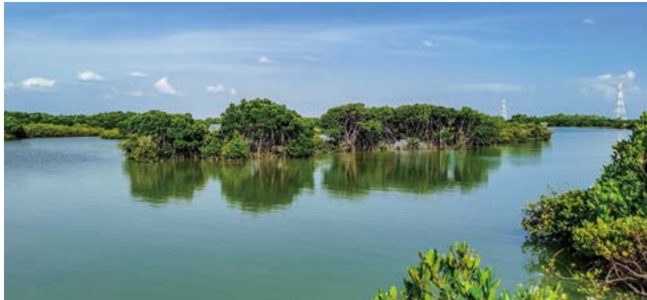
红树林小岛立于海天一色的美景之中。

宣传都做得越来越好，雷州半岛西海岸的科普及宣传也在不断提升，雷—琼地区的热带生物多样性题材显然大有可为。