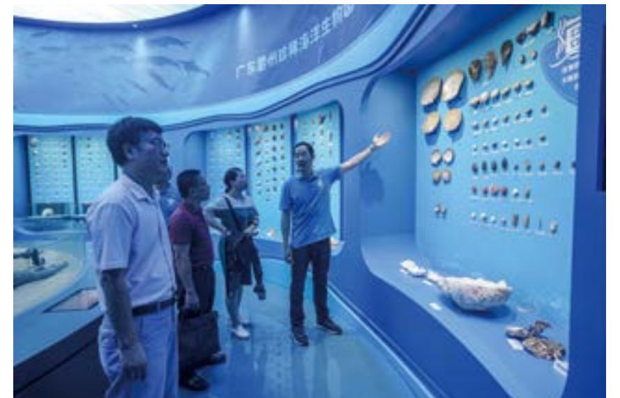
广东雷州珍稀海洋生物国家级自然保护区，创新公众参与保护理念效果显著。