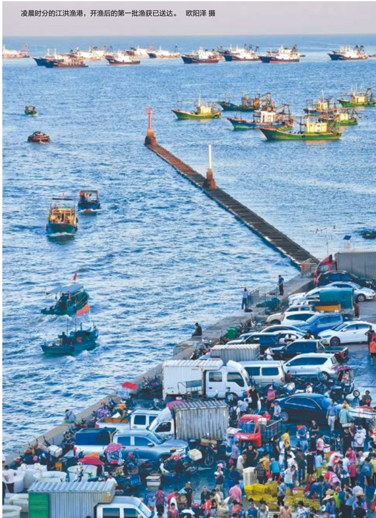
凌晨时分的江洪渔港，开渔后的第一批渔获已送达。