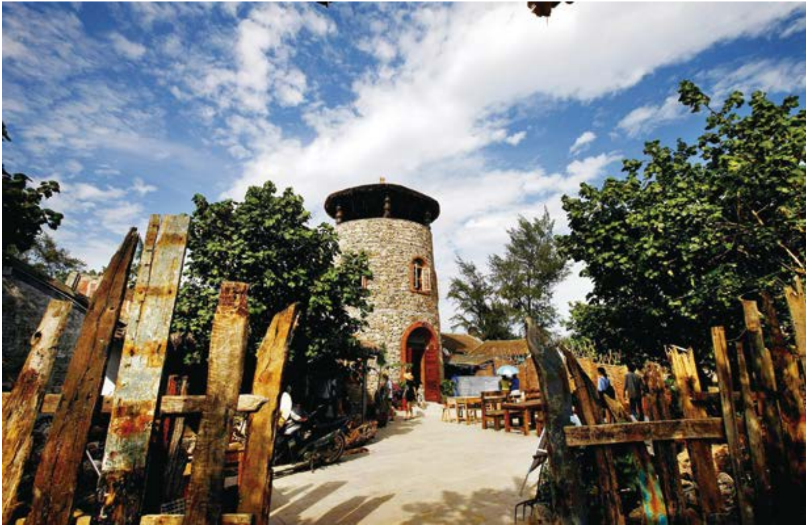
徐闻南极村的农家乐民宿设计别具一格。

正是由于珊瑚礁的存在，角尾－西连海岸也被称为“中国最美海岸”。从雷州半岛西海岸北部的高桥红树林，到南部的角尾“南极村”，这里突出的生物多样性不仅是自然界的宝库，更是上天赐给我们的瑰丽风景。在这一段短短百余公里的岸线上，任何一个热爱自然的人都能找到大海和半岛最原始的野性。