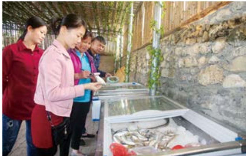
放坡村红色驿站党员志愿服务队。

近年来，徐闻县坚持固本培元，努力把基层党组织打造成为坚强的战斗堡垒。深入实施新一轮基层党组织建设三年行动计划，一体推进各层级各领域党组织建设，推动基层党组织建设全面过硬、全面进步。坚持抓好机关、事业单位、国有企业、非公企业和社会组织等领域基层党建工作，不断扩大基层党的组织覆盖和工作覆盖，持续推进新兴领域党的建设。坚持以“红色村”党建示范工程为抓手，整合各级资源打造基层党建示范带、示范片区。继续探索创新“党建+”模式，总结推广“3151”党建模式的经验做法，推动“产业带党建联盟”升级为“产业链党建联盟”。坚持抓党建促重大任务落实，制定