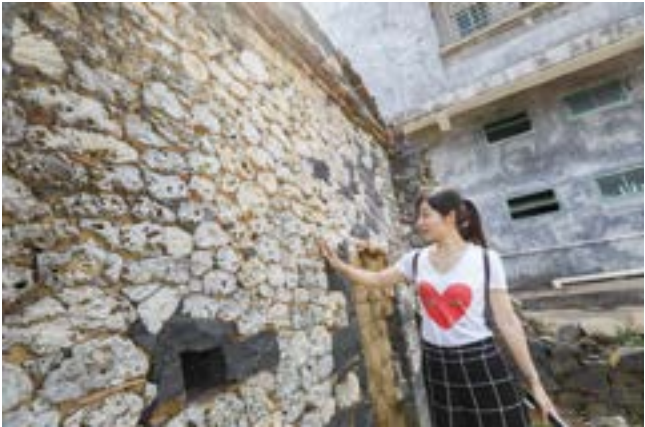
珊瑚礁通风透气，曾是渔民盖房子首选建材。