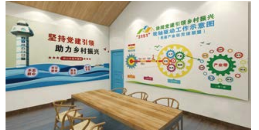
“南极村”民宿产业链党建联盟基地。

今年1月14日，“菠萝公社”乡村振兴人才驿站揭牌启用，这是全国首家以菠萝为主题打造的乡村振兴人才驿站，为推动菠萝产业新发展，夯实人才基础，2月