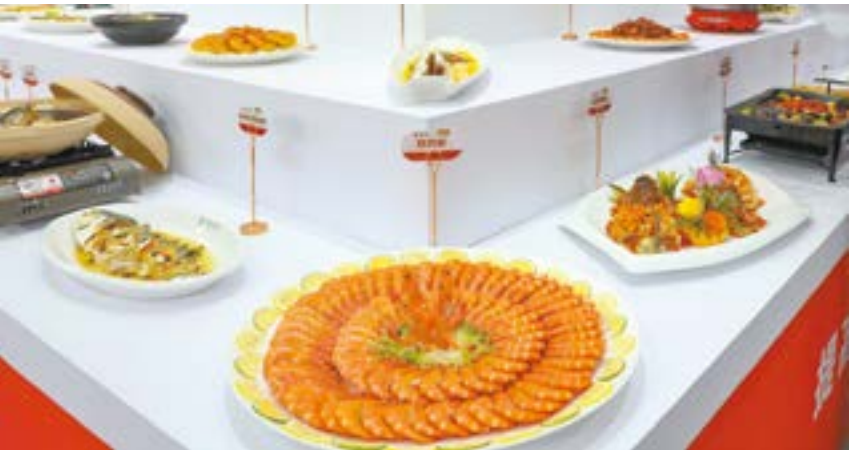
湛江水产预制菜。

曾进泽指出，我市高度重视预制菜产业发展和国际水产城市建设工作，出台了《推进湛江市预制菜产业高质量发展十二条措施》等扶持政策。他强调，各地各部门要加大预制菜产业投入规模，完善产业布局；健全预制菜产业园机构、人员，设置招商专班，做好服务对接工作；发挥预制菜联盟作用，制定安全标准；创新用足用好金融政策，实行多种融资方式；研究创新商业模式，