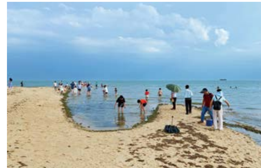
徐闻南极村灯楼角附近，市民游客正在海滩上游玩。

点地区也逐渐被游客们“玩腻了”，玩家们都在国内到处搜寻小众的、未开发的、独特的旅游目的地。而雷州半岛的西海岸恰恰满足很多人的期待。