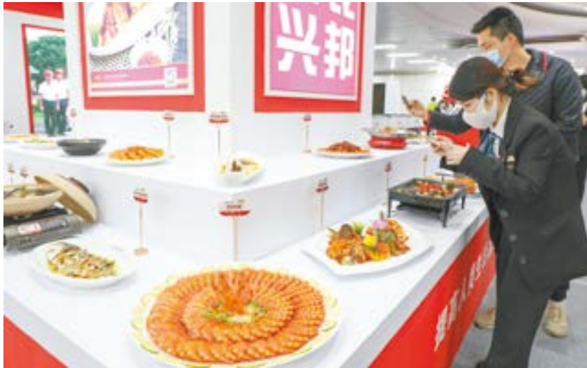
湛江市水产产业高质量发展大会在湛江国际会展中心召开。与会人员参观湛江市水产产业成果展。