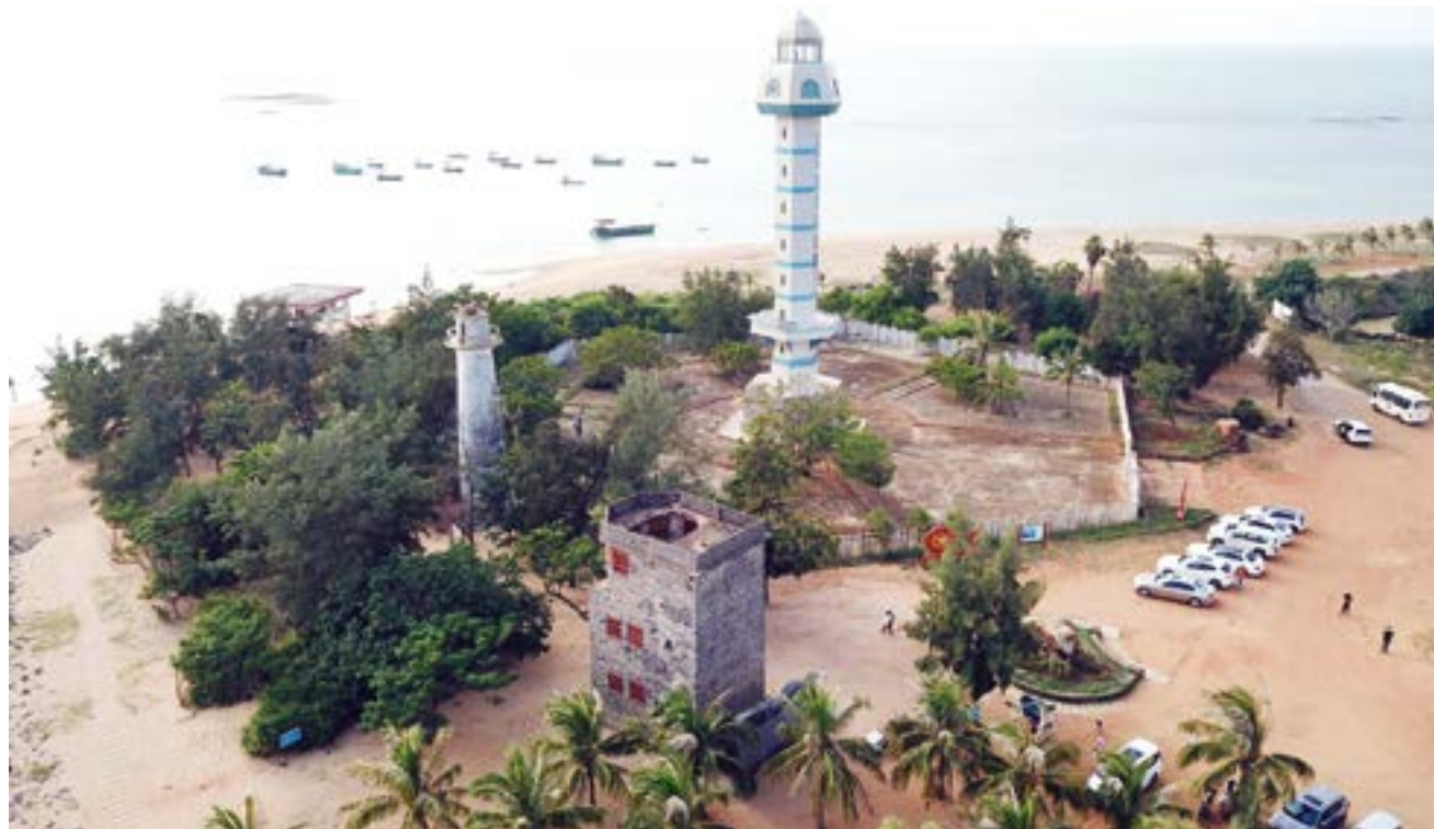
徐闻南极村。

放坡村位于角尾乡西部，始建于秦汉年间，北宋大文魁苏东坡贬谪海南岛儋州，获赦归途，归心似箭，乘儋州船家一叶扁舟，抄近水路于放坡村鹅房埠登岸，停留一宿，并作诗一首，“重登观骇浪，儋耳送归来，可喜兴文教，帆书谢大才”。当时村民为感怀大诗人，遂将村名改为“放坡”以示追念。同时，放坡村还是一个具有重要意义的红色革命老区，是解放游击战争和解放海南岛渡海作战重要根据地。