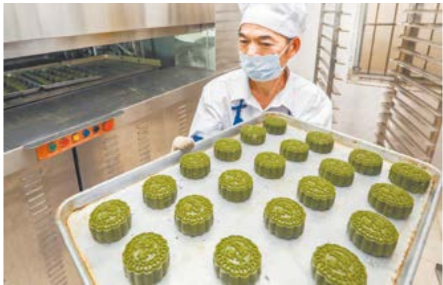
安铺月饼生产企业，师傅正在制作辣木月饼。

规模较大的有五六家，以手工制作作为特色，工艺水准高、口味独特，在广东月饼市场独树一帜。每到中秋节前就有大量市民和游客驾车来安铺购买月饼，顺带品尝安铺美食。对老饕们来说，中秋、春节以及廉江红橙上市的11-12月都是去安铺大快朵颐的好时节。这座历史悠久的小镇在岁月长河中不但留下了百年骑楼、多年传承的工商业体系，还给我们留下了舌尖上的馈赠，在繁忙的都市之外保留着一方美食的天堂。