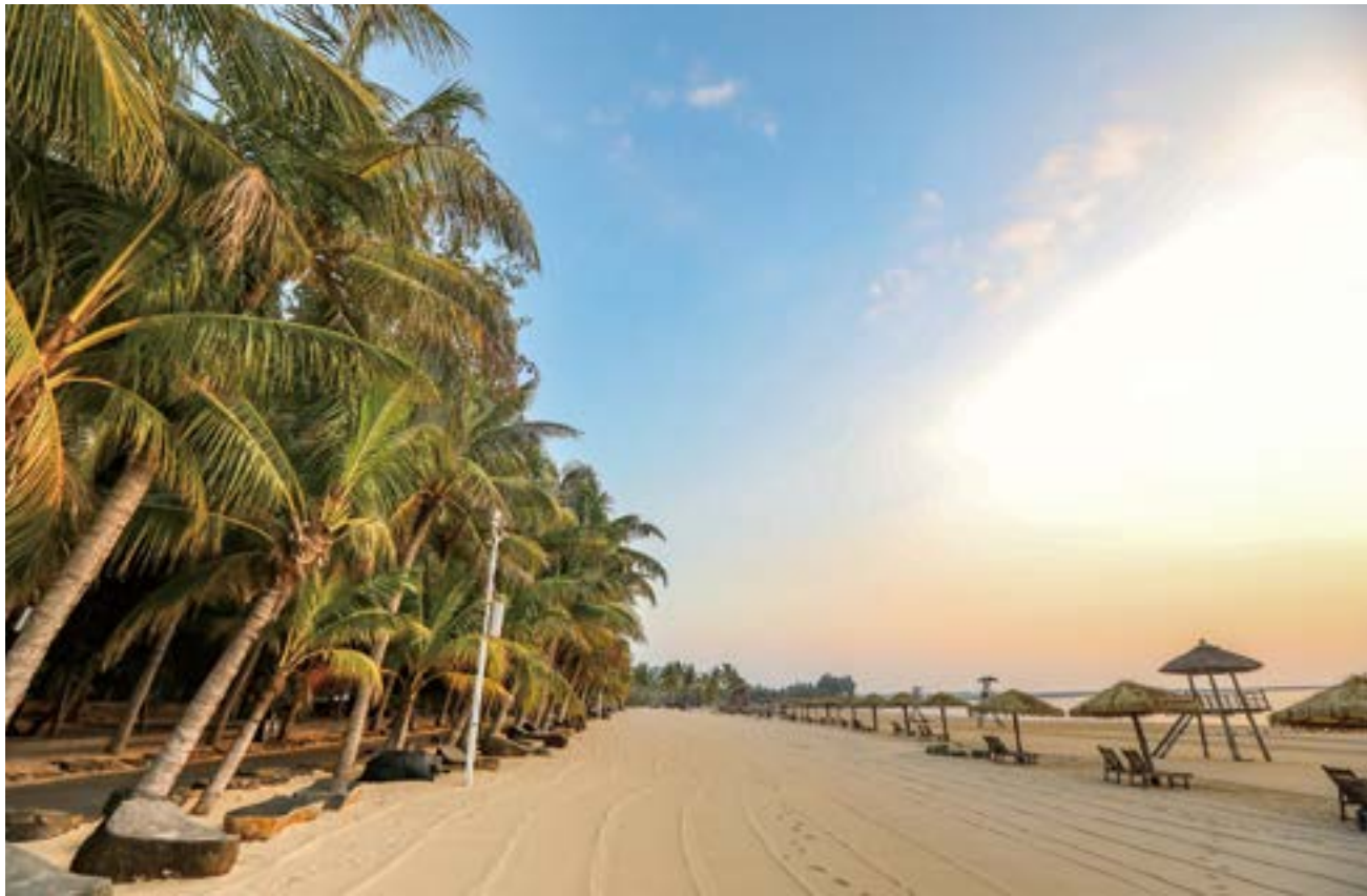
乌石天成台旅游度假区是国家 3A 级旅游景区，总占地面积 600 多亩，沿海沙滩长达 70 多公里。