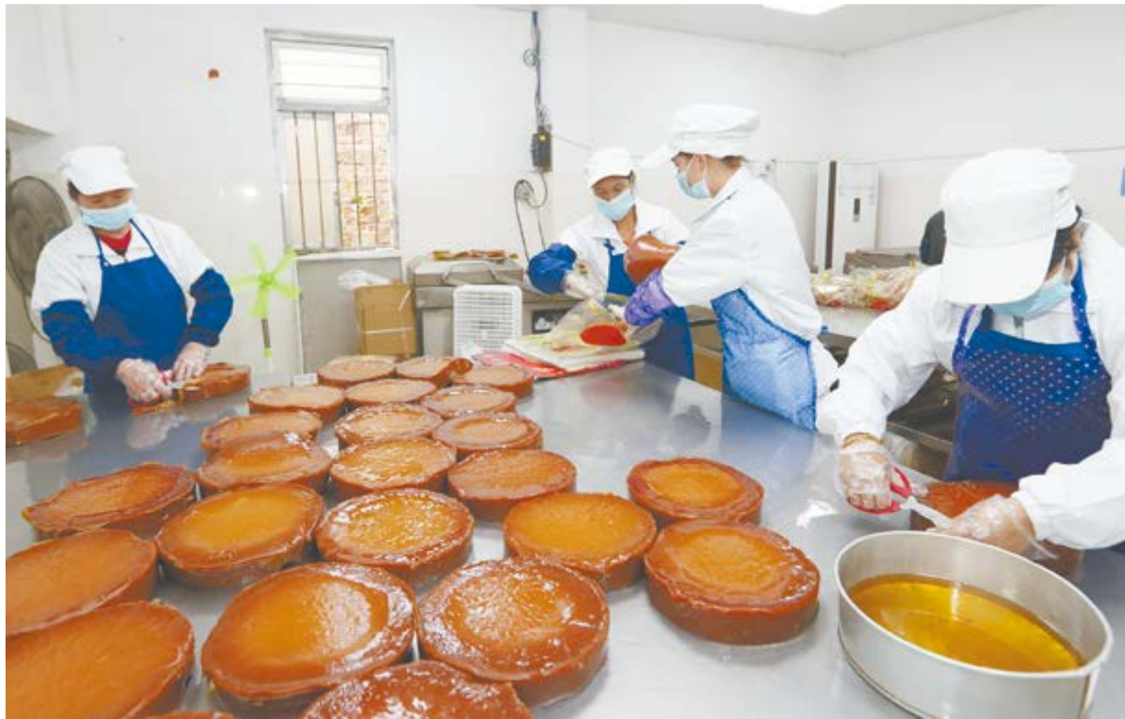
安铺镇助力企业扩容提质，成效显著。现在廉江市真奇达食品厂备足原材料，已开始生产春节特色食品——年糕。