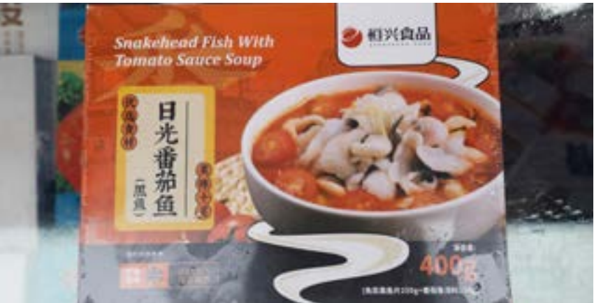
恒兴预制菜。

实现水产预制菜与水产交易融合发展；服务对接好 RCEP，在预制菜和水产方面与各方建立更紧密的关系；进一步细化国际水产城规划，做到规划超前、科学、全面，补齐短板，完善基础配套。要切实增强推动预制菜产业发展的责任感和紧迫感，打造好“中国水产预制菜之