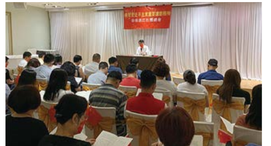
认真学习习近平主席重要讲话精神。

历史进程，必须要坚持贯彻“一国两制”方针，在“一国”的原则下，香港背靠祖国，“两制”的优势才得以发挥。青年人是香港未来的希望，我们必须加强学习，认识国家、了解国家，在民族复兴的伟大历史进程中积极贡献我们的青春和才能。