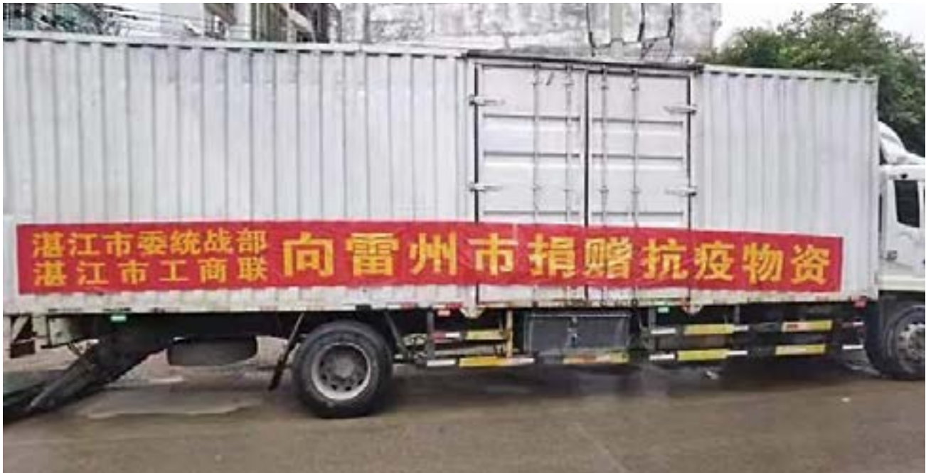
湛江市委统战部、湛江市工商联向雷州市捐赠抗疫物资。

“0804”疫情以来，市委统战部、市工商联贯彻落实市委、市政府部署要求，充分发挥新时代民营经济领域的优势作用，统筹做好疫情防控和安全生产工作，多方面动员、各层次部署、全方位行动，为打赢疫情防控硬仗贡献民营经济的智慧和力量。