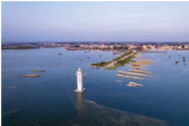
美丽的北潭港，灯塔浸泡在海水中。