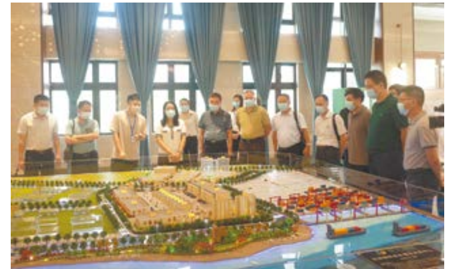
实地调研福州市中印尼“两国双园”。

通过调研，课题组了解到我市存在对接RCEP的配套体制尚未完善、企业在对接RCEP贸易新规则时整体准备不足、缺乏RCEP规则的系统研究、基础设施和配套服务尚待完善、外宣外联“湛江声音”尚处弱势等的现状和难点。摸准问题才能对症下药。课题组表示，将针对企业存在的个性与共性问题，围绕如何整合统