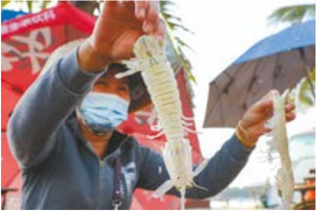
乌石渔港，小贩展示新鲜虾蛄。

在海堤上吹着海风、看着渔港的灯火和对岸北拳海滩的椰林，喝着甜酒糟和啤酒，吃着海鲜，才能真正体会到大海赋予人们那种无拘无束的自由。而根据海边人的生活节奏，晚饭之后的一顿宵夜才是一天美食体验的最高峰，这里的宵夜有很多选择：雷州牛杂，类似四川麻辣烫的吃法，一串串牛杂边煮边吃，蘸料任选。各色烧烤，如烧蚝、扇贝、鱿鱼、牛羊肉等品种繁多。海鲜小炒，炒蟹、炒猫眼螺、剥皮鱼、海鲢、椒盐虾蛄、龙头鱼……再配上海鲜粥或者炒粉，吃完后一定要沿着海堤走上几圈才能心满意足地回去睡觉。