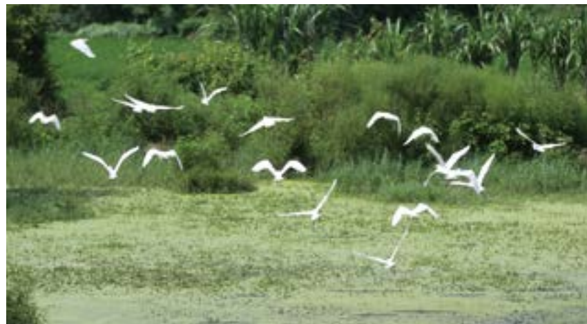
候鸟成群栖息在九洲江红树林带。

实际上除了乌石，整个西海岸还有非常多的观鸟热点。全球共有 8 条主要的候鸟迁徙路线，其