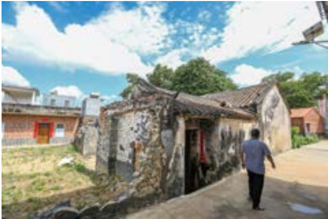
博袍村这座古民屋用珊瑚礁砌墙而成，饱经沧桑屹立不倒。