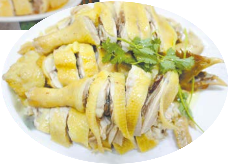
▼ “安铺鸡”已经是安铺有名的招牌。

承粤菜特色，色香味俱佳，尤以安铺鸡饭为著。以后他家制作鸡饭的厨艺代代相传，至今又融入了现代饮食文化特色，闻名粤桂琼3地。安铺鸡饭选用本地粘米或香米，以鸡汤加鸡油煮成饭，饭粒粘性不高、颗粒完好、晶莹剔透。