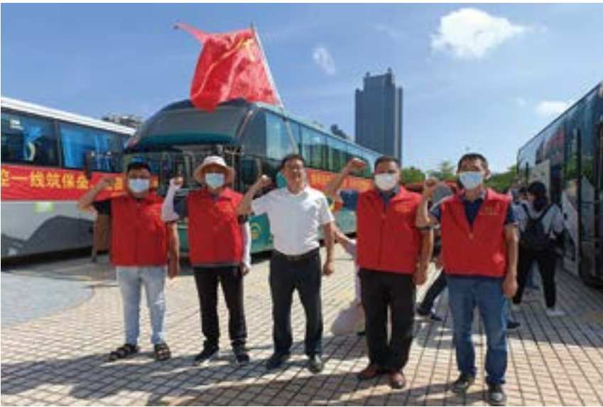
市委统战部党员先锋队员参加出征宣誓。

先锋队将充分发挥战斗堡垒和党员先锋模范作用，以对党和人民高度负责的态度，听从指挥、服从安排，敢于担当、勇于作为，