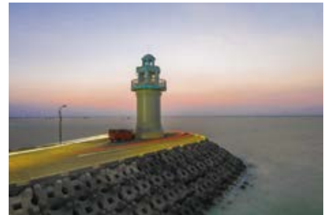
到天成台游玩，少不了参观网红打卡点——灯塔，它巍峨屹立在乌石港的前沿，点燃了旅途上的明灯。