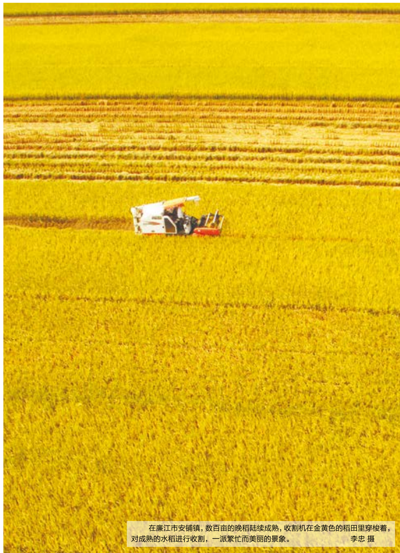
在廉江市安铺镇，数百亩的晚稻陆续成熟，收割机在金黄色的稻田里穿梭着，对成熟的水稻进行收割，一派繁忙而美丽的景象。