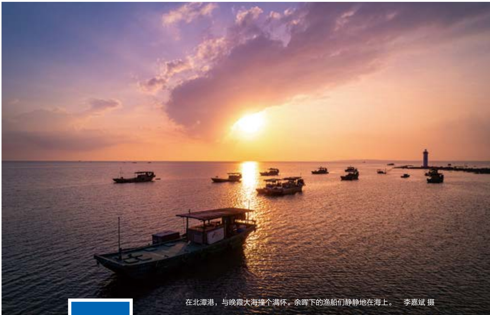
在北潭港，与晚霞大海撞个满怀。余晖下的渔船们静静地在海上。