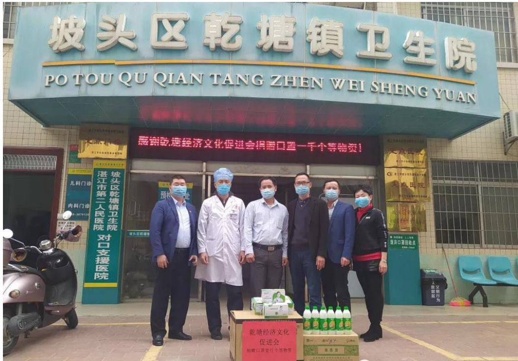
(乾塘经济文化促进会为乾塘卫生院捐赠防护物品)