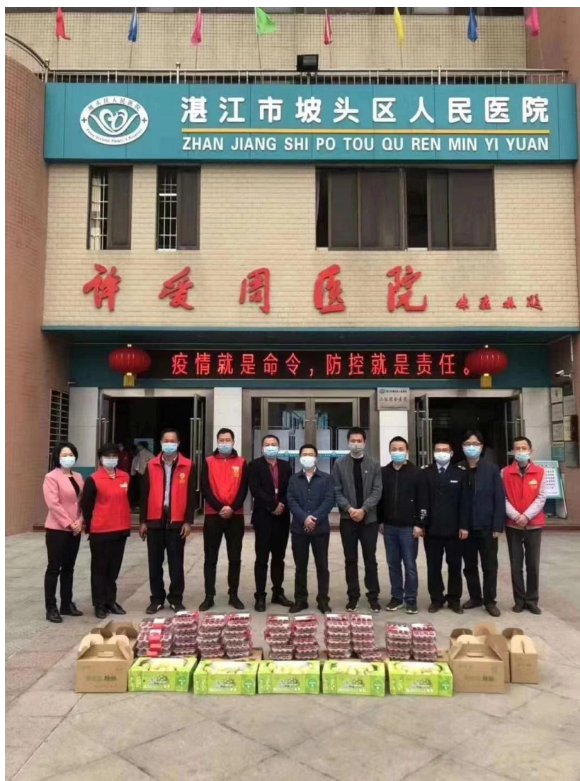
(湛江市钟繇实业有限公司为坡头区人民医院捐赠红杨桃、青枣和草莓等生态农产品)

口服液和消毒液等物资共三批，为乾塘镇政府、各村委会、派出所、供电所等一线工作人员捐赠 2000 个一次性医用口罩。